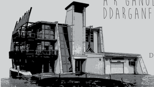
Doc Y Gogledd