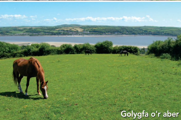
Golygfa o'r aber